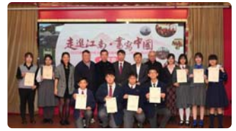
魯青獎江南行 | 「走進江南·書寫中國」文學交流營分享會成功舉行