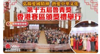
(有片) 第十五屆魯青獎香港賽區頒獎禮 從魯迅精神談文化認同