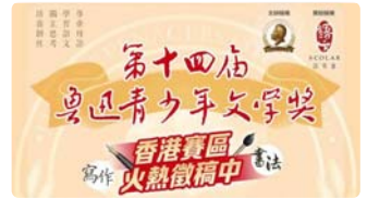
魯迅誕辰142周年 第十四屆魯青獎香港賽區啟動禮今舉行