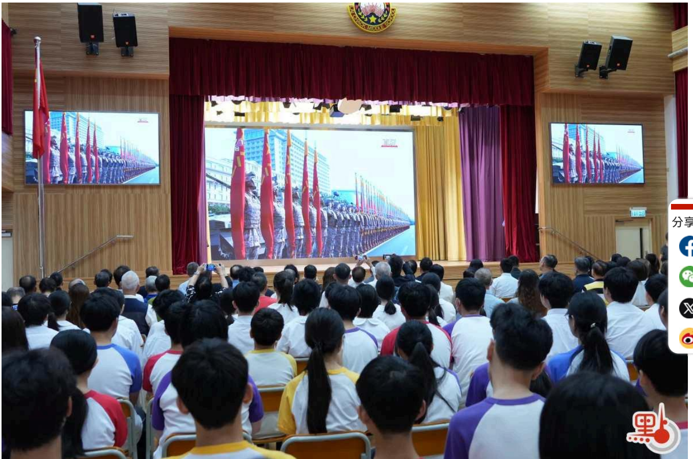
麗澤中學師生及各界代表共同觀看閱兵式直播。