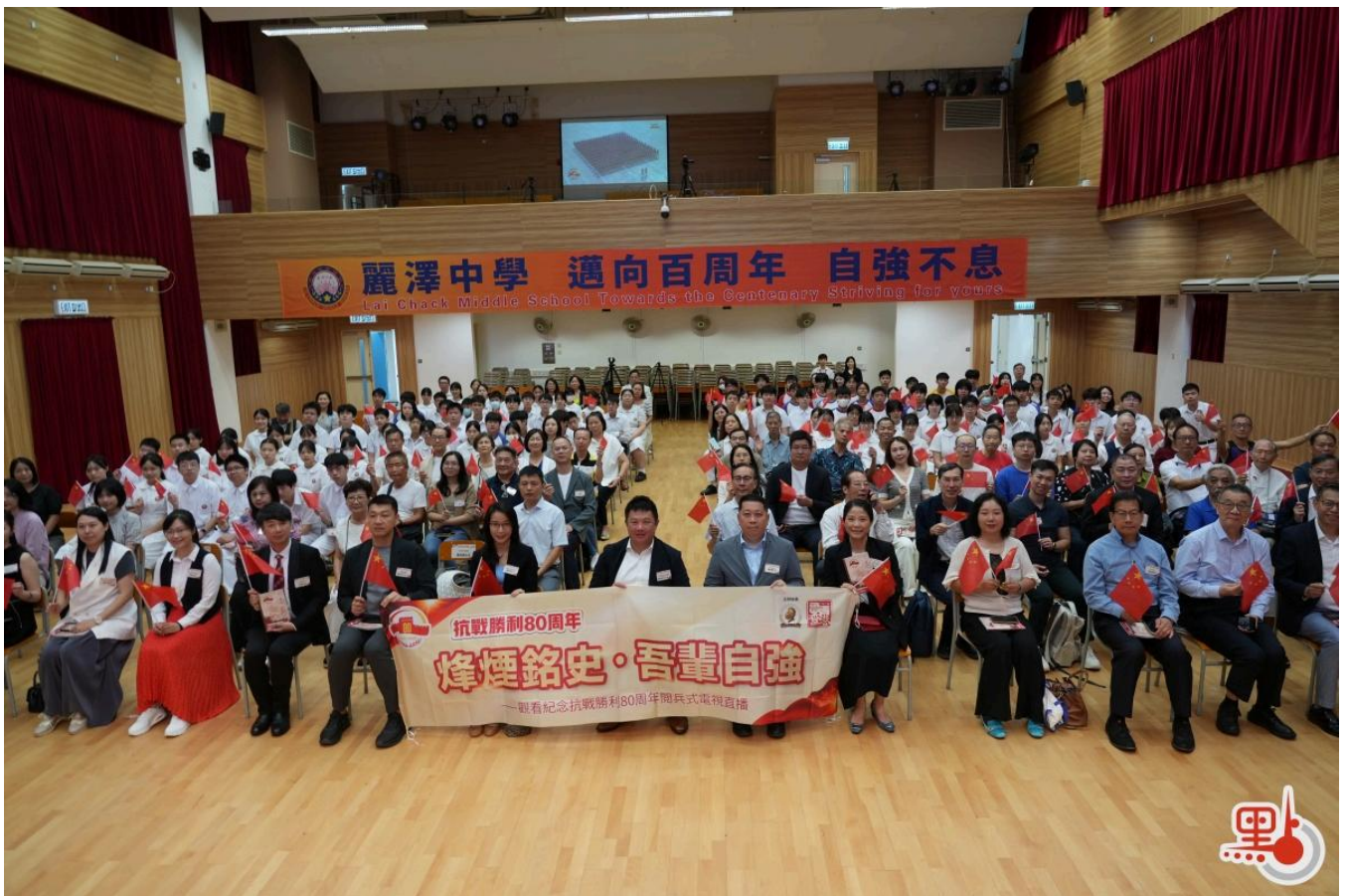
麗澤中學師生及各界代表觀看閱兵式直播。

活動現場，全體師生及各界代表全神貫注地觀看閱兵式直播。當禮炮轟鳴震徹雲霄，當國旗護衛隊護送五星紅旗冉冉升起，當軍樂團奏響激昂樂曲，當中國自主創新研發的戰鬥機翱翔在天安門上空.....麗澤中學現場爆發出熱烈的掌聲，展現香港社會與祖國同心同行的堅定信念。