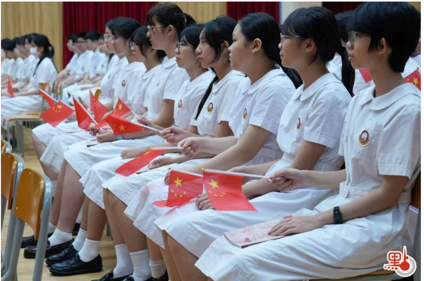
麗澤中學師生及各界代表共同觀看閱兵式直播。