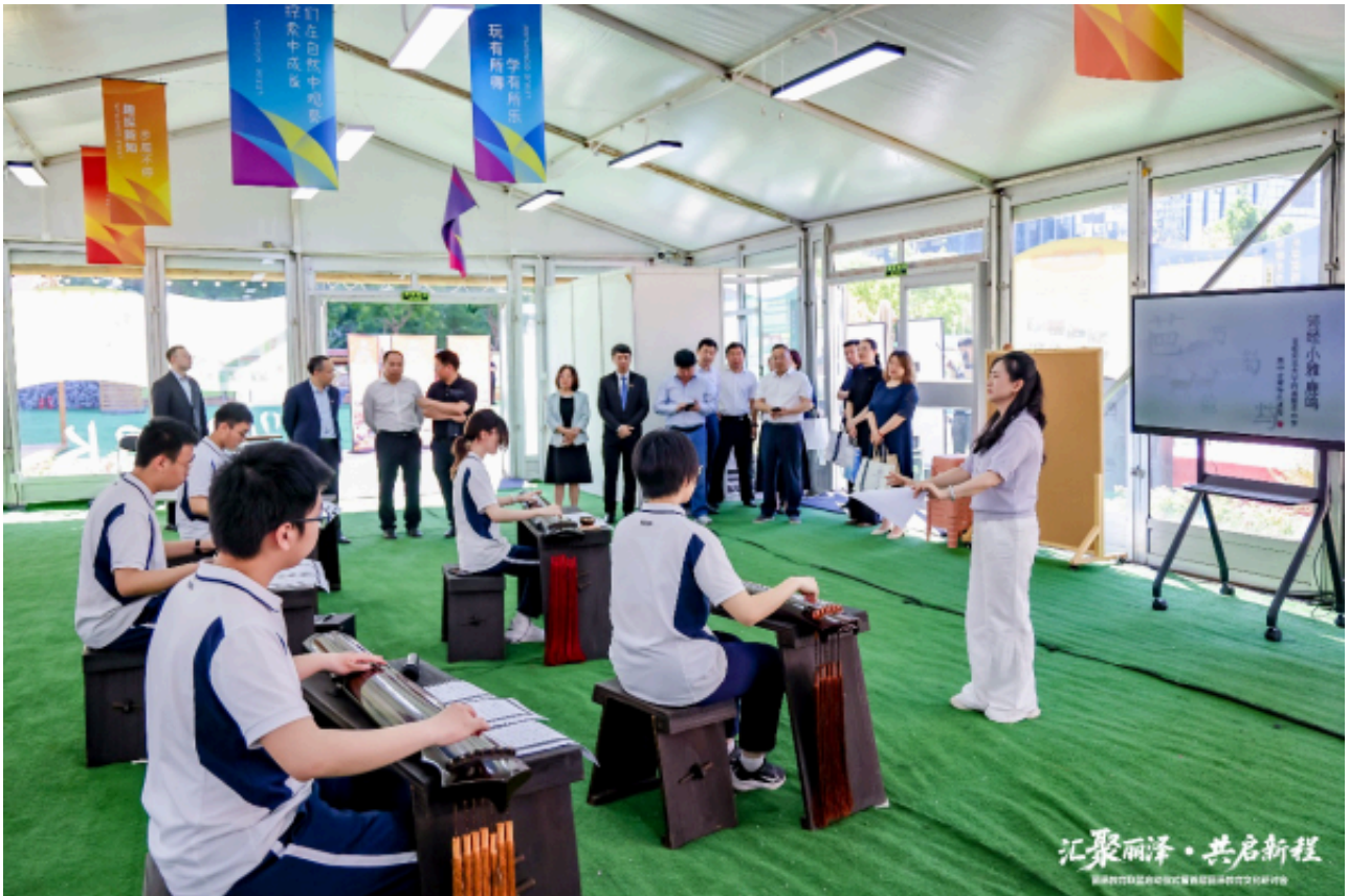
中華優秀傳統文化傳統系列社團——古琴社