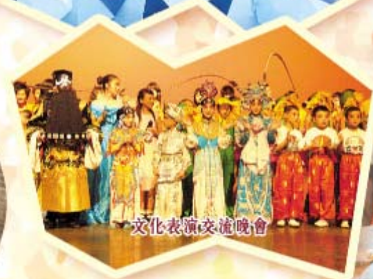
文化表演交流晚會