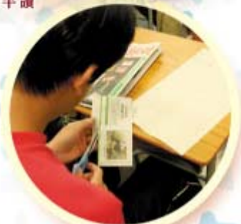
午間閱讀(時事知多少)