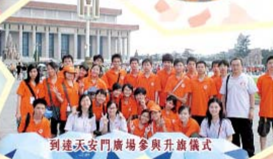
到達天安門廣場參與升旗儀式