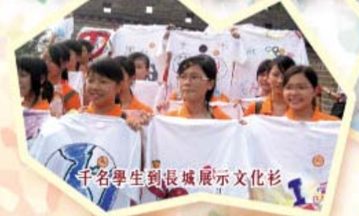
千名學生到長城展示文化衫