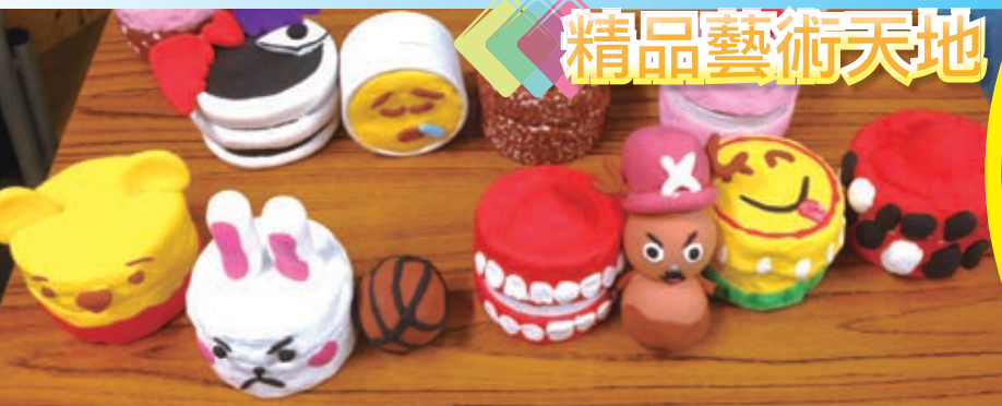
「精品藝術天地」活動，透過製作小手工活動，藉以培養同學對精品製作的興趣。