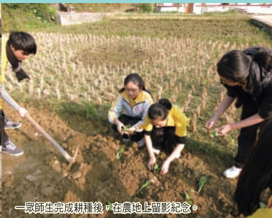
一眾師生完成耕種後，在農地上留影紀念。