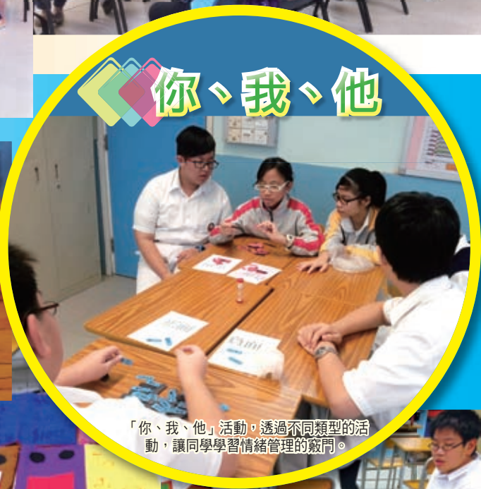
「你、我、他」活動，透過不同類型的活動，讓同學學習情緒管理的竅門。