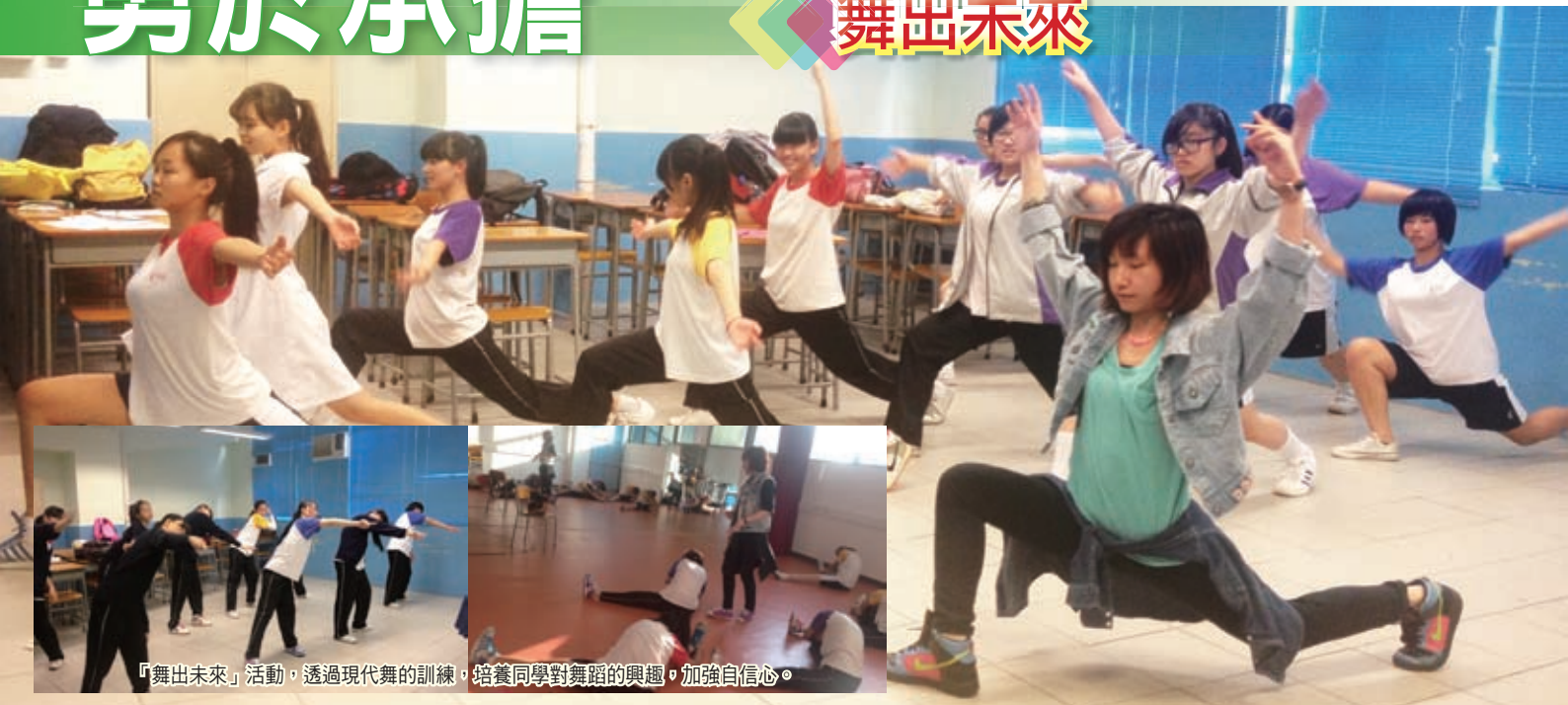
「舞出未來」活動，透過現代舞的訓練，培養同學對舞蹈的興趣，加強自信心。