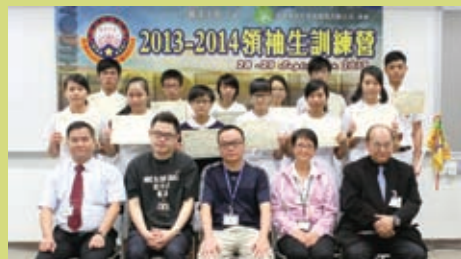
同學們與老師及導師一起拍照留念

在2013年9月28至29日，麗澤中學一群應屆領袖生共46人，當中包括中三至中五同學，大家濟濟一堂地齊集於若昭校園禮堂紮營留宿，體驗到一個如假包換的「領袖訓練『營』」。各領袖生齊集於若昭校園禮堂，先進行開營禮、決志及團體分組活動，在「精神士氣訓練」及「隊旗隊歌製作」活動中，各領袖生都表現得積極投入，在士氣高昂及愉快歡樂的氣氛下，完成各隊所屬的隊旗及隊歌，並充分體現了服務及合作精神的重要性。透過各式各樣的訓練項目，同學經過兩天密集的訓練後，大家都期望能把在營內所學到的知識運用於所屬的群體，發揮各人的領導才能。