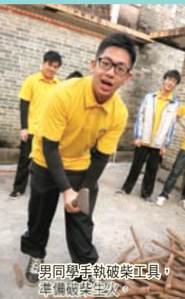
男同學手執破柴工具，準備破柴生火。

在2013年12月21及22日，麗澤中學校長、老師及一群領袖生共45人，一大清早一起前往肇慶及新興作出了一次不一樣的農村生活體驗——耕種及野炊活動。這是在現今繁華社會，普遍拿著手機或電玩的城市人難得經歷到的生活體驗。