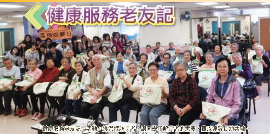
「健康服務老友記」活動，透過探訪長者，讓同學了解長者的需要，藉以達致長幼共融。