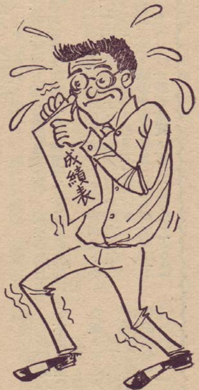
最緊張的一刻 一何時了—