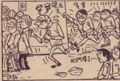
考試最後一晚 → —陳積—